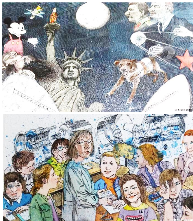
Графика Клауса Энзиката

СССР и США», «В окрестностях деревни Смеловка», «Юные фанаты в швейцарской глубинке» и т. д. В рисунках-аллегориях, выполненные в стилистике поп-арта, мы узнаем образы советской и американской пропаганды периода холодной войны в том числе – обезьяну, запущенную в космос США, и собаку Лайку – «героиню советской космической эпопеи»; старушку с внучкой, пасших корову близ деревни Смеловка Саратовской области в момент катапультирования Гагарина; русского мальчика, замороженно слушающего рассказ дедушки о космическом полете Юрия Гагарина и, разумеется, решающего стать космонавтом. Обнаруживаем мы в художественном мире Клауса Энзиката и учеников швейцарской школы, восторгающихся Гагариным, намеренных брать с него пример [11].