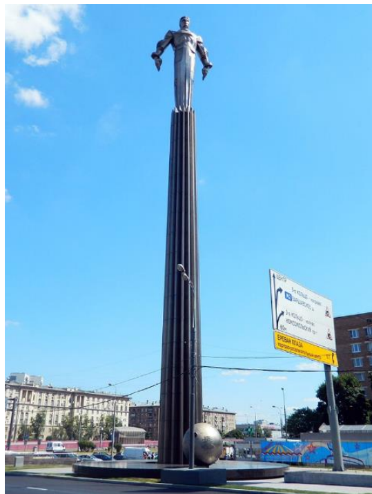
Памятник Ю.А. Гагарину, г. Москва