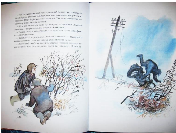
Нагибин Ю. Рассказы о Гагарине. Ил. Г.А. Мазурина

он, конечно, с трепетом внимает рассказам учительницы о русских витязях и героях войны 1812, всегда готов прийти на помощь нуждающимся в ней, как может, вредит немецким оккупантам; и уж очень напоминает история Юры и Пузана другую известную историю о Мальчише-Кибальчише и Плохише [8].