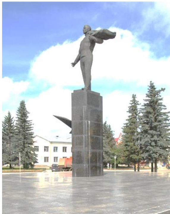
Памятник Ю.А. Гагарину, г. Гагарин

Символ 2. Человек шагает как хозяин... Идеологически этот символ продвигался как «человеческое лицо социализма»: знаменитая «гагаринская улыбка», призывы к миру, зарубежные турне... Уже через три недели после своего полета в космос Юрий Алексеевич отправился в Чехословакию, в итоге – с высокой интенсивностью объездил более 30 стран, каждый раз становясь героем митингов, лекций, пресс-конференций, официальных приемов. Конечно, он должен был воплощать идеал советского человека, на этот образ должны были работать его биография, личные качества, внешность. Что касается биографии Юрия Алексеевича, то в пропагандистских материалах она отлилась в четкую, «бронзовую» формулу: «внук путиловского рабочего, сын крестьянина, летчик-космонавт СССР», где последнее – почетное звание, учрежденное Указом Президиума Верховного Совета СССР от 14 апреля 1961 года. Формула наглядно демонстрировала возможности, открытые перед любым советским человеком, – «социальный лифт», который не снился странам буржуазных демократий. Советским гражданам было чем гордиться, к чему стремиться.